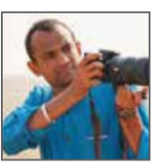
ગર્ક વોચર A.A.R.T.I Adventure Campsite

ગુજરાતમાં નોંધાયેલ નથી. માટે અહિંયા વસવાટ કરતાં ધોર ખોદીયા જાતે જ પોતાનો ખોરાક શોધવા મજબૂર છે. ખૂબજ નિડર, નિર્ભય આ પ્રાણી આજે વિલુપ્તીની કગાર પર છે.